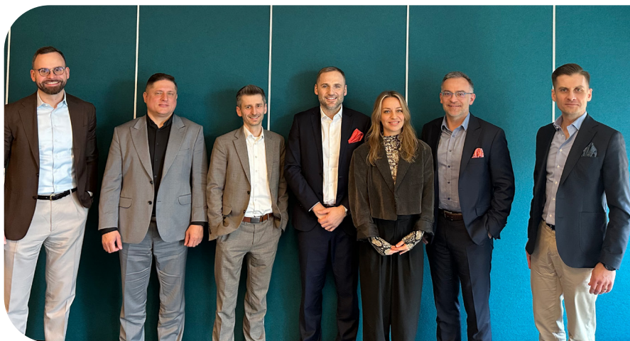
Grupa firm Truck Rental

W dniu 26 lutego br. odbyło się pierwsze stacjonarne spotkanie grupy Truck Rental. Było ono okazją do oficjalnej inauguracji grupy oraz omówienia najważniejszych tematów dla branży wynajmu i leasingu samochodów ciężarowych. W trakcie spotkania uczestnicy określili priorytety działań na najbliższy rok w tym oszacowanie wielkości rynku (ustalenie standardu raportowania floty samochodów ciężarowych) oraz poprawę bezpieczeństwa w zakresie weryfikacji kierowców, tonażu (wagi ładunków) oraz kontroli technicznej samochodów ciężarowych. Poza tym przedmiotem dalszych prac grupy będą działania edukacyjne dotyczące elektryfikacji taboru ciężkiego oraz przygotowanie przewodnika zwrotu pojazdów ciężarowych.